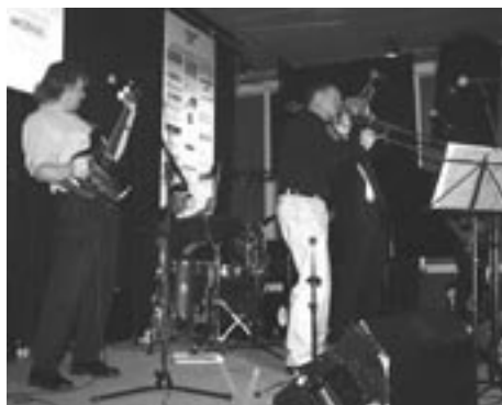
Riverband i aktion